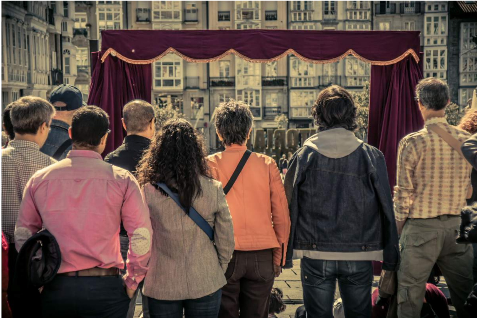
“Al otro lado”. Zanguango teatro